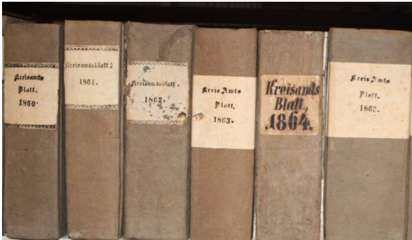
Hunderte Jahre Herrschinger Geschichte sind im Gemeindearchiv sorgfältig verwahrt.

Herrsching, altes Haus, geh weida, bleib stehn. Mit diesem wehmütigen Seufzer könnte die Gemeinde einen sehr runden Geburtstag feiern: Ein Gemeinwesen zwischen dörflicher Tradition und großstädtischem Lifestyle feiert sich selbst. „Herscaningun“, wie die paar Hütten in einer Urkunde von 776 hießen, wird unter dem Namen „Herrsching“ 1250 Jahre alt. Die historische Spanne reicht von Tassilo III. bis Söder I., vom unbekanntem Dorfältesten des Jahres 776 bis zu Schiller. Das Rathaus stellte nun den Plan fürs große Jubel-Fest im Juni 2026 vor.