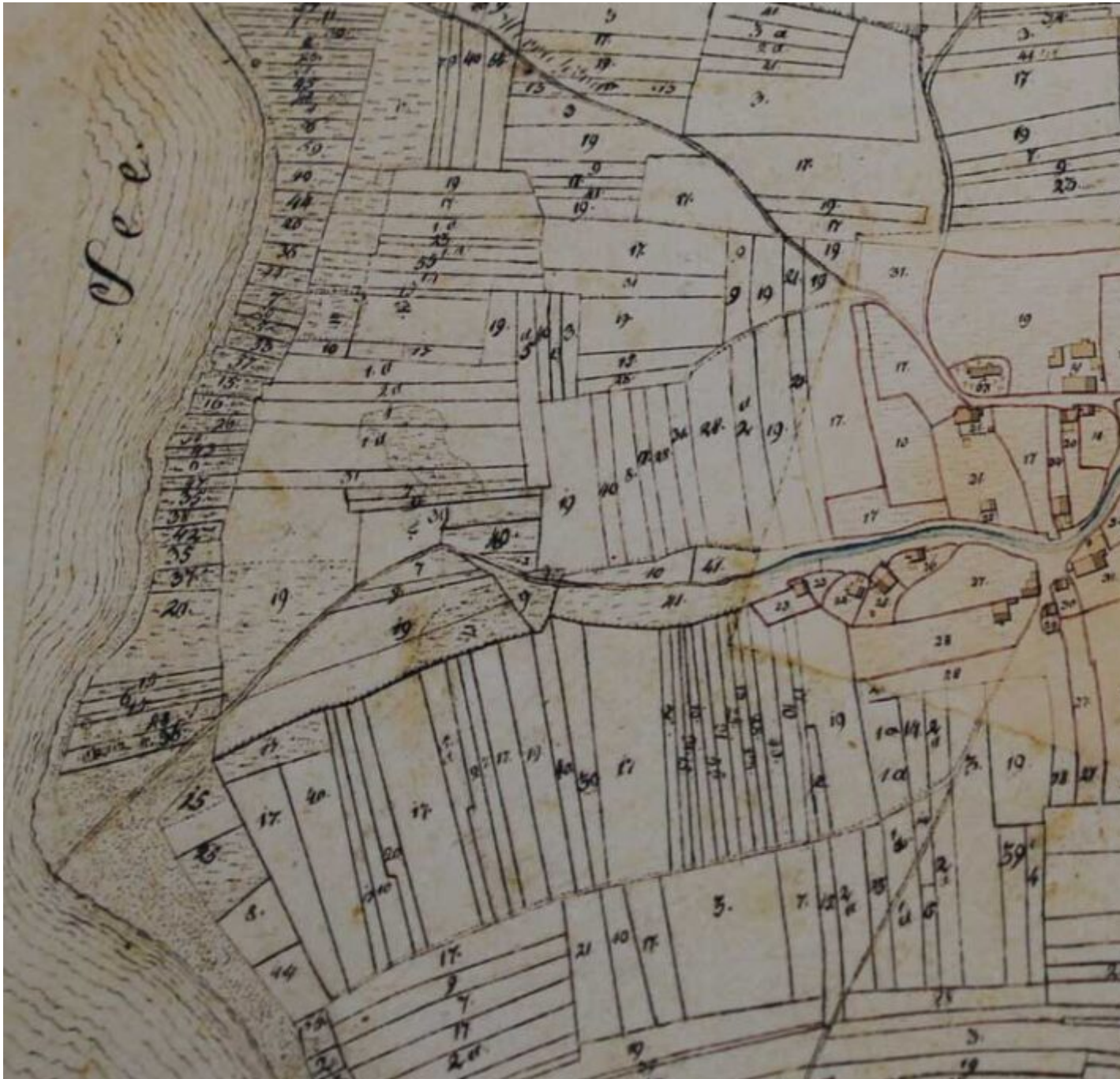
Eine Karte des Dorfes Herrsching aus dem Jahre 1809. Damals durfte der Kienbach noch durchs ganze Dorf mäandern.