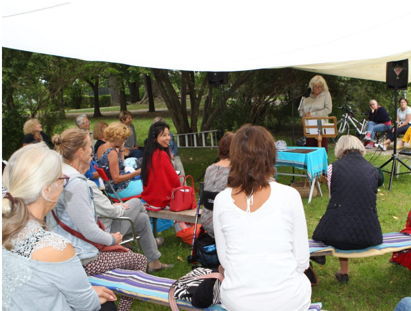
Lesung im Kurpark: Das Objekt der Poesie ist nur ein paar Meter entfernt

herrsching.online darf nun aus einigen Texten des Buches zitieren.